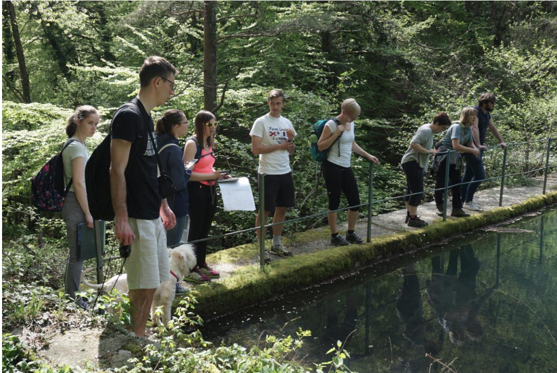
Slika 1: Terenski ogled stanja objektov kulturne dediščine in preučitev možnosti zasnove poti.