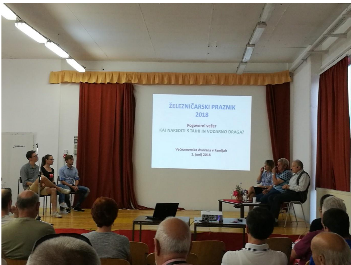
Slika 2: Predstavitev delnih rezultatov projekta na Dnevu železničarjev, 1.6.2018, Famlje